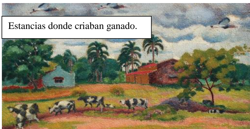
Estancias donde criaban ganado.