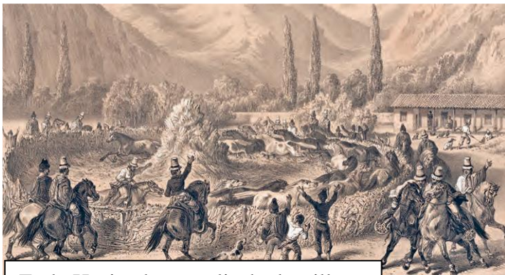
En la Hacienda se realizaba la trilla.

Observa las siguientes imágenes para profundizar los conceptos vistos en esta guía.