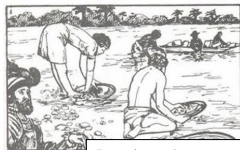
Lavaderos de oro